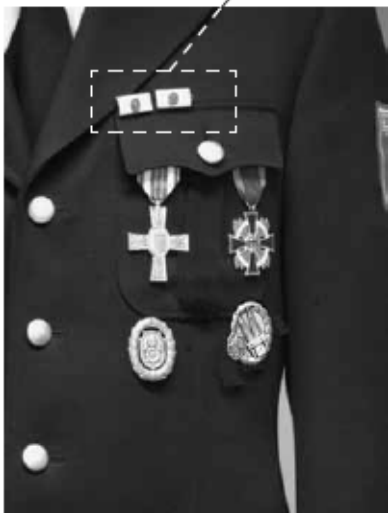
Beispiel für die Trageweise der Leistungsabzeichen (ohne Steckkreuz)

Bandschnallen können alternativ zum Leistungsabzeichen getragen werden