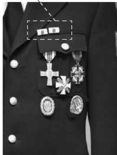
Beispiel für die Trageweise der Leistungsabzeichen (zusammen mit dem Steckkreuz)